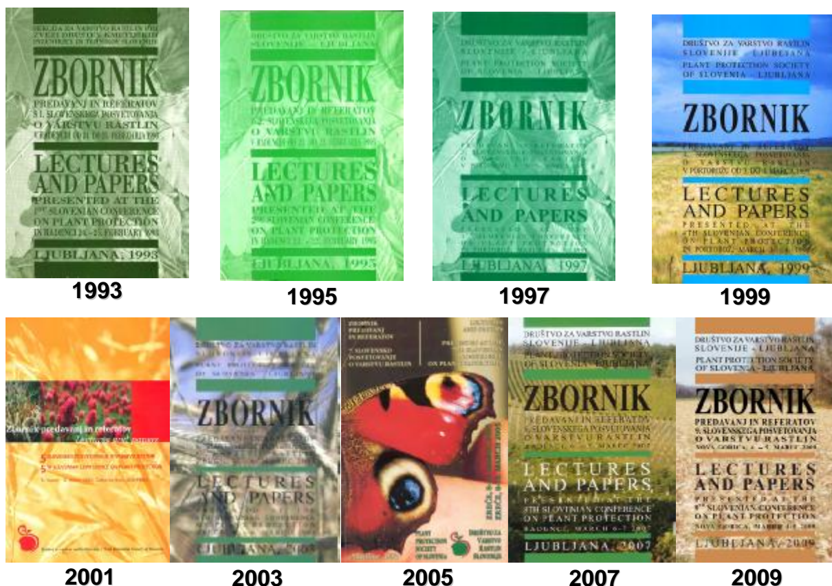
Slika 6: Platnice dosedanjih devetih Zbornikov predavanj in referatov s slovenskih posvetovanj o varstvu rastlin

622 (so)avtorjev, od katerih je bilo prvih avtorjev, to je udeležencev, ki so tematiko tudi dejansko predstavili, 297.